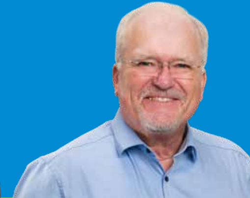
Wolfgang Faißt Bürgermeister, Kreis- und Landesvorsitzender der Freien Wähler, 62, Renningen, verheiratet, 3 Kinder

Meine Ziele: Regionalplanung mit Weitsicht für Wohnen, Gewerbe und regionale Energiestandorte. Zuverlässiger S-Bahnbetrieb und Ausbau der Infrastruktur für den ÖPNV.